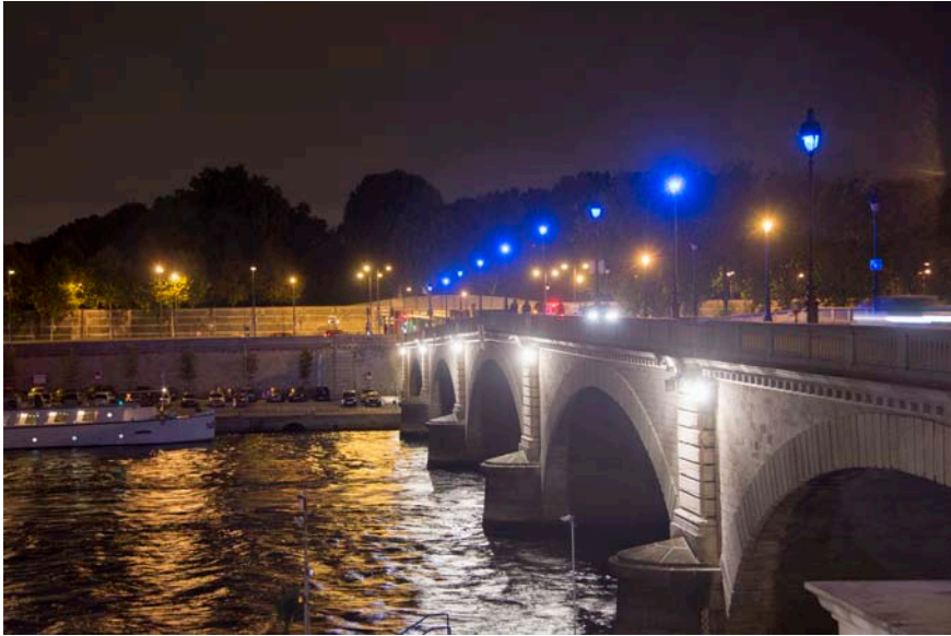
Nøne Futbol Club Work n°017 : Blue Eyes - La ronde de nuit Gyrophares, lampadaires, Pont de Tolbiac / Dimensions variables / 2014