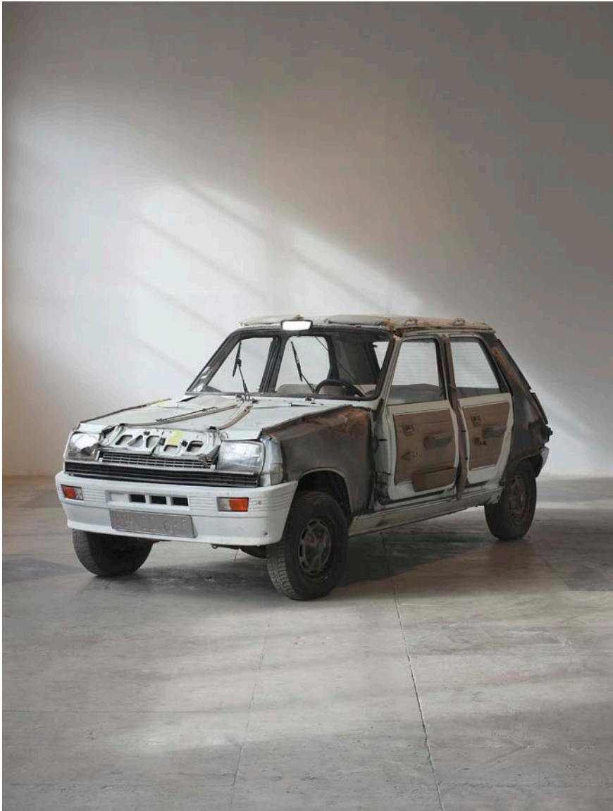
Nøne Futbol Club Work n°206 : 1984 Renault 5, Renault 5 édition limitée "Lauréate", 352 x 152 x 140 cm, 2011