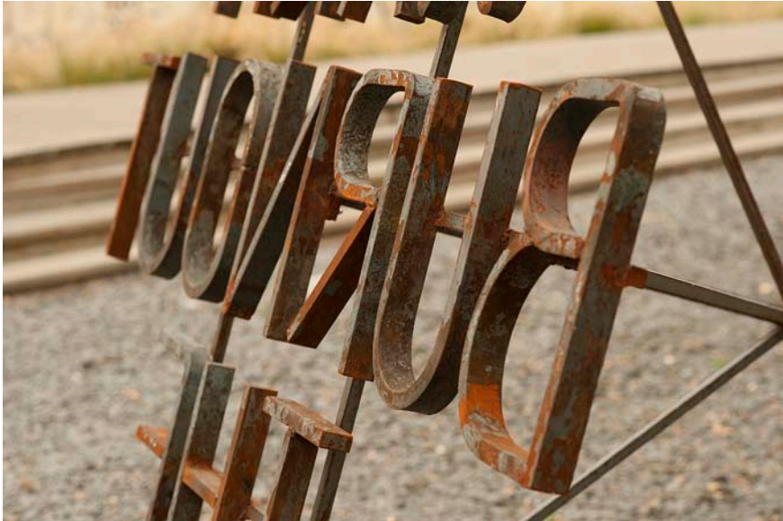
Nøne Futbol Club Work n°054-2 : Keep warm burnout the rich (stabile) Acier forgé / 200 x 160 x 300 cm / 2011 Collection N. Libert/E. Renoird