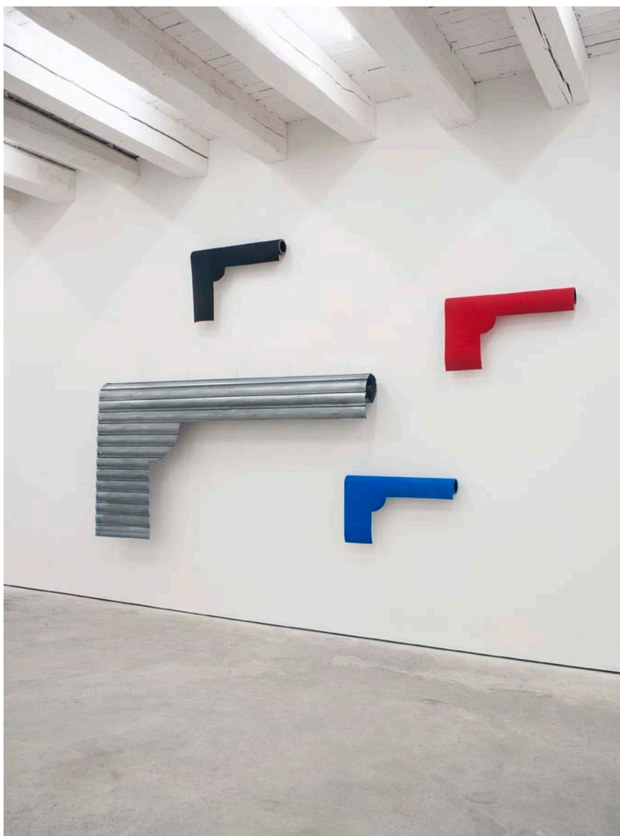
Nøne Futbol Club Work n°357 : Magnum Rideau métallique, moquette, tubes en cartons / Dimensions variables / 2013