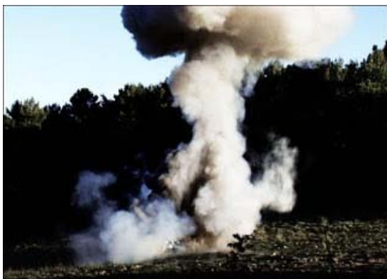
Florian Pugnaire, David Raffini, Energie sombre, 2012. Vidéo.

Courtesy les Eglises, Chelles et Musée national Pablo Picasso la Guerre et la Paix, Vallauris © Florian Pugnaire, David Raffini Florian Pugnaire Sans titre, 2010 Tôle d'inox, sangle à cliquet env.100x200cm (1/10) Courtesy Romain TORRI, crédit photo Aurélien Mole