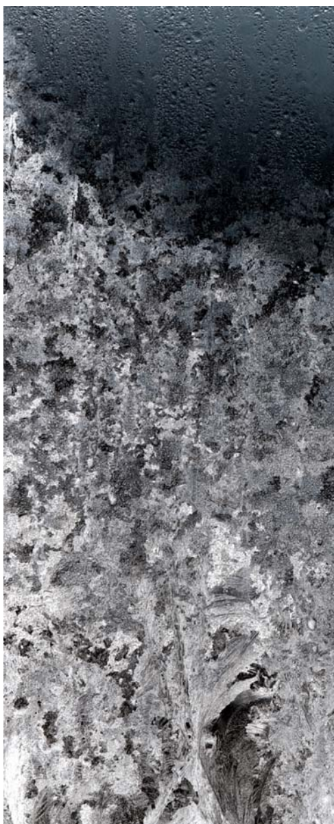
Variations , 2010. impression pigmentaire couleur sur papier 152 cm x 300 cm.