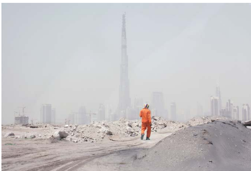
Tower , 2009 impression pigmentaire sur papier 170 x 110 cm