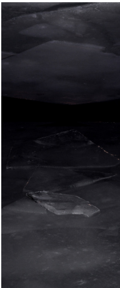
Variations , 2010. impression pigmentaire couleur sur papier 152 cm x 300 cm. © Cécile Hartmann, courtesy de l'artiste