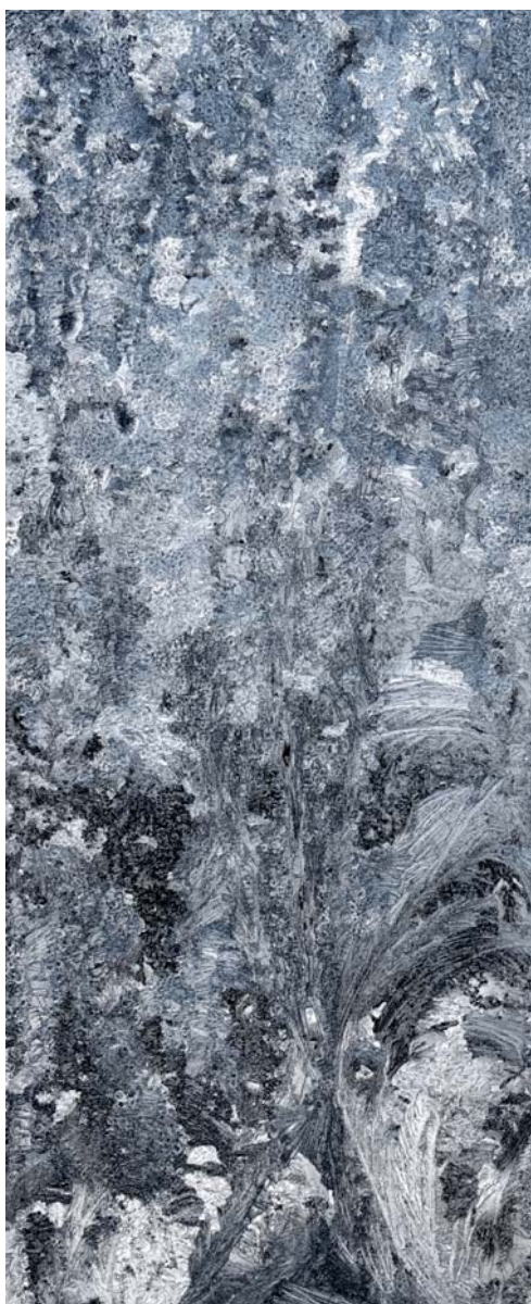
Variations , 2010. impression pigmentaire couleur sur papier 152 cm x 300 cm.